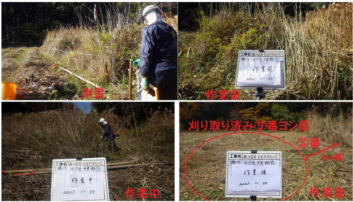
④谷戸内草刈り作業場 360 m 2 作業日：10月20日、27日、11月3日 谷戸横断道上流側